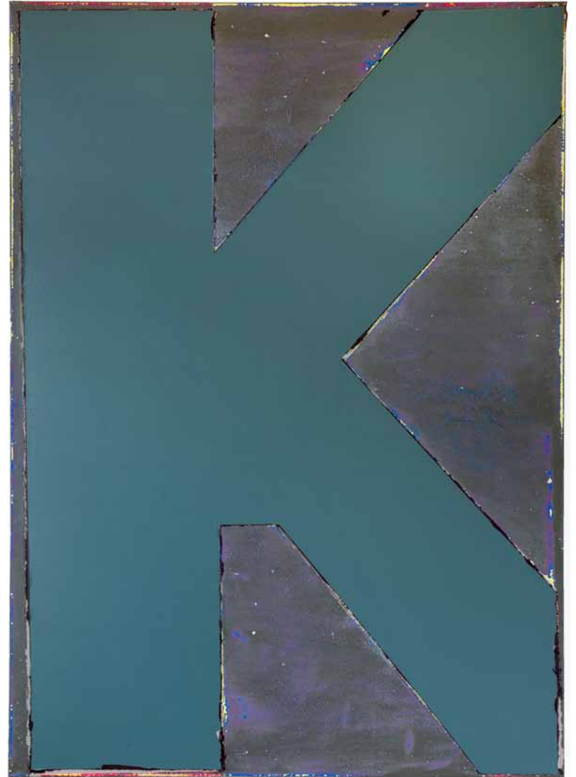
Buchstabiertes Unbild K 2017 140 x 100 cm Alkydlak op doek